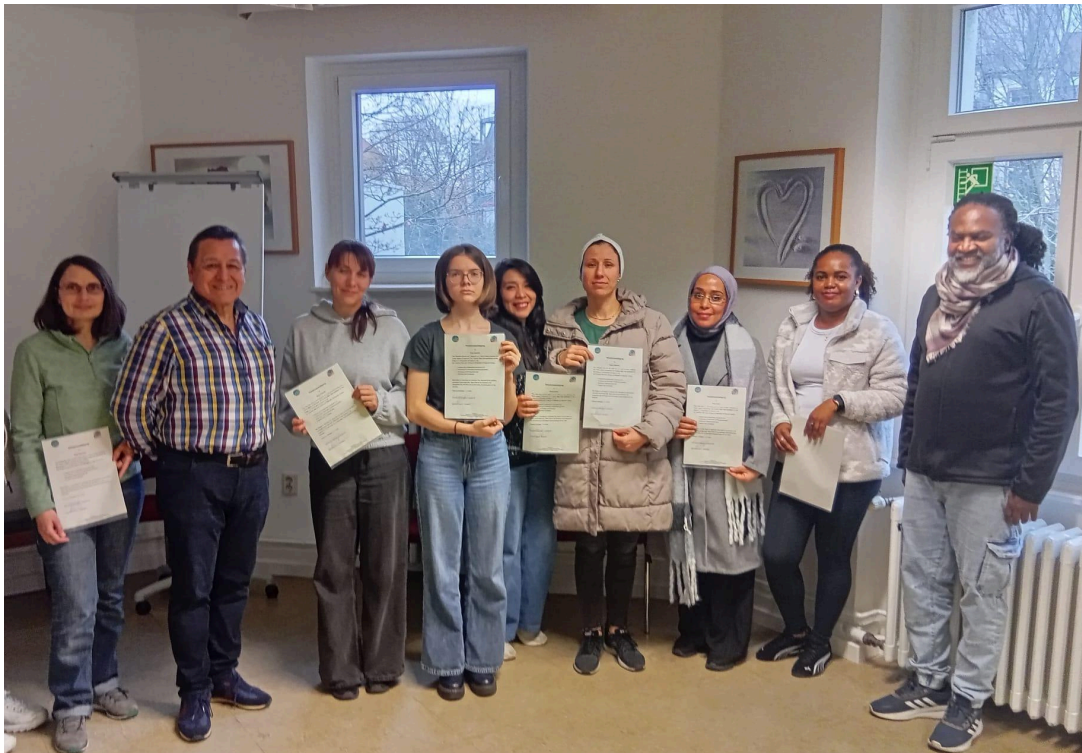
Kooperationsangebot "Digitale Kompetenzen für Frauen*" mit Capoa e.V.