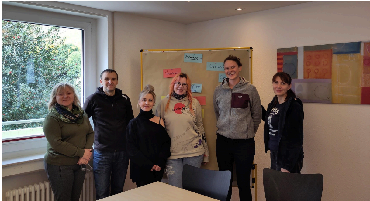
Kooperationsangebot "Sprachtraining Bewerbungsgespräche" mit Bildung für alle e.V., Foto: Bike Bridge e.V.

Wir danken allen Unterstützer*innen, ehrenamtlich Engagierten und Freund*innen für das Vertrauen und die wertvolle Unterstützung!