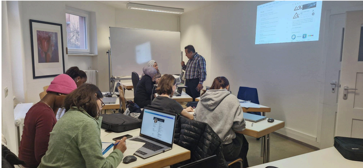
Kooperationsangebot "Digitale Kompetenzen für Frauen*" mit Capoa e.V.

Im Rahmen unseres etablierten Begegnungsformats "Hofcafé" fanden außerdem zwei Berufsberatungsangebote statt: Ein Angebot des Wegweiser Bildung (Volkshochschule Freiburg) und ein Angebot durch die Kontaktstelle Frau und Beruf (Südlicher Oberrhein). Beide Akteurinnen stellten ihre jeweiligen Angebote für Frauen mit Zuwanderungsgeschichte vor und standen für Fragen zur Verfügung. Dafür mischten sie sich unter die Besucher*innen unseres Begegnungsereignisses, um eine natürliche Gesprächsatmosphäre zu gewährleisten. Mehrsprachiges Informationsmaterial ermöglichte niederschweligen Zugang zu bspw. berufsqualifizierenden Maßnahmen. Teilweise war auch eine direkte Beratung auf den jeweiligen Herkunftssprachen der Frauen* durch die jeweilige Vertreterin der Kooperationspartner*innen möglich.